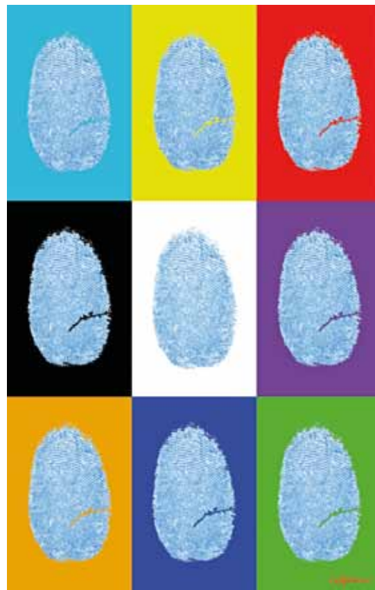
The Source of Identity