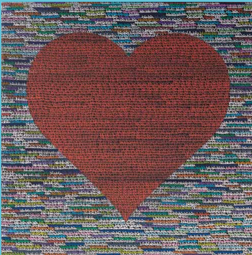
Untitled 2012, 100 × 100 cm